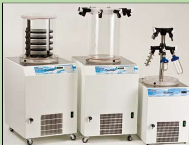
Frysetørrere til brug i laboratorier

Endvidere bruges frysetørring til konservering af arkæologiske genstande af organiske materialer (træ, læder, tekstiler, reb etc.). I organiske materialer, der har ligget længe i vand eller fugtig jord, er cellerne helt fyldt med vand og cellestrukturen meget nedbrudt; derfor er oldsagerne ikke i stand til at holde deres oprindelige form, hvis de blot tørrer ud. Dette undgås, når vandet fordampes i frysetørringsprocessen.